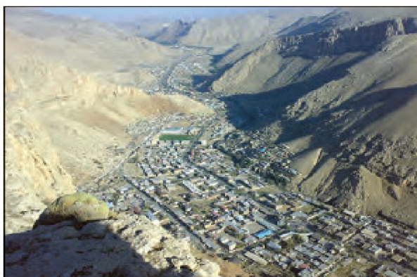
شکل ۸ - ماکو - آذربایجان غربی

۷- به تصاویر مربوط به دو سکونت‌گاه توجه کنید. چه عاملی بر گسترش این سکونت‌گاه اثر دارد؟ این عامل بر نحوه‌ی گسترش این سکونت‌گاه‌ها، چه تأثیری داشته است؟